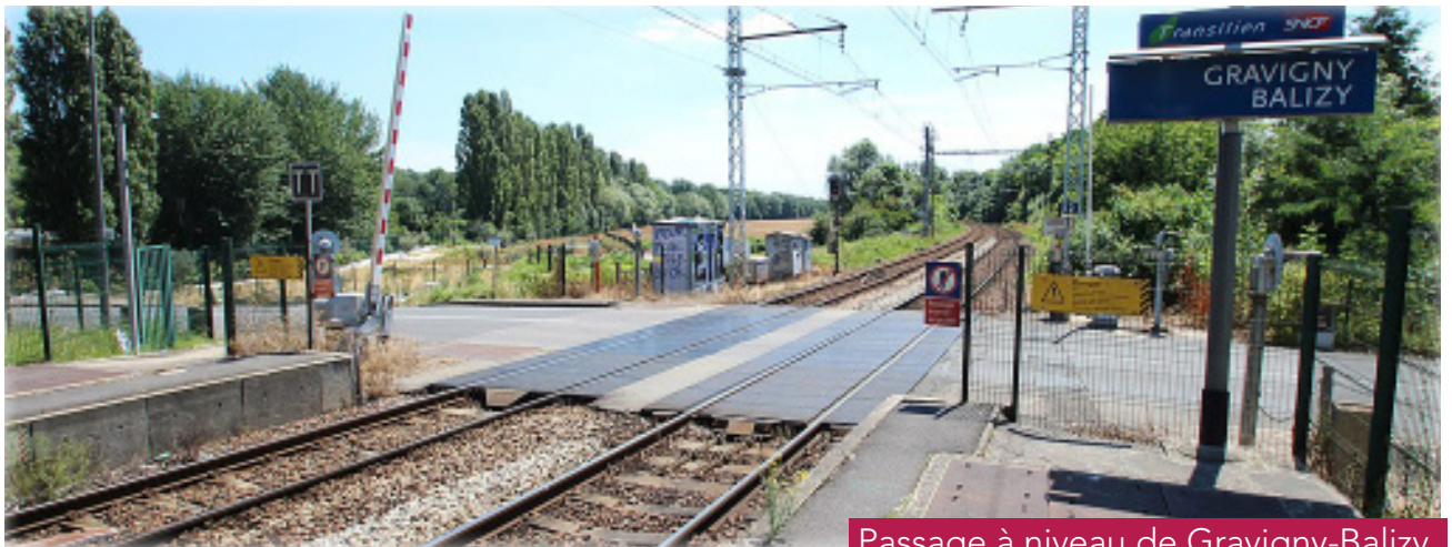
Passage à niveau de Gravigny-Balizy

Dans le cadre du futur Tram-Train T12, des travaux complémentaires d'aménagements des voies doivent être réalisés. Ils nécessiteront le démontage du passage à niveau et, par conséquent, une interruption totale de la circulation routière.