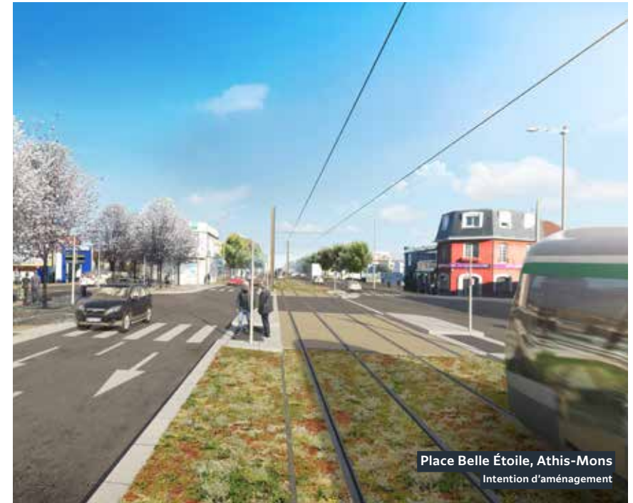
Place Belle Étoile, Athis-Mons Intention d'aménagement

Le comblement des passages souterrain routiers et piétons démarre à l'été 2023 et constitue une nouvelle étape majeure de ces travaux préparatoires.