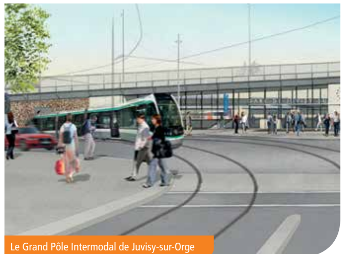
Le Grand Pôle Intermodal de Juvisy-sur-Orge

Plus d'information sur www.gpi-juvisy.fr