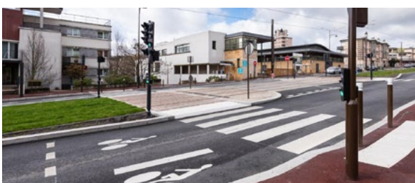
Des bandes et pistes cyclables le long du tracé avec un marquage bien identifié.