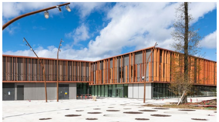
Un atelier-garage élaboré et conçu par le groupement AIA.