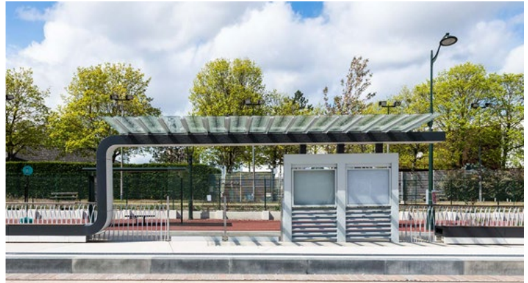
Des stations épurées, esthétiques et sécurisées qui s'intègrent sobrement dans l'environnement urbain.