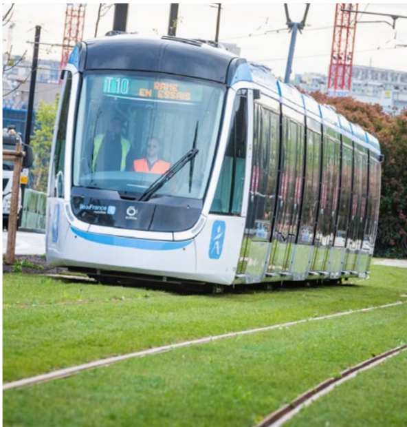
Une plateforme végétalisée prenant la forme d'un long ruban vert.

A vec l'arrivée du Tram T10, les aménagements urbains et paysagers ont également profité d'un nouvel élan (rénovation des voiries, trottoirs élargis et plantés, création d'itinéraires cyclables...) pour permettre un partage plus équilibré des circulations et valoriser l'espace public. Le Tram T10 donne une impulsion nouvelle au territoire, en offrant à ses habitants et salariés un cadre de vie renouvelé et apaisé.