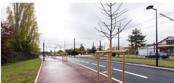
Au fil de la ligne, des aménagements paysagers diversifiés.