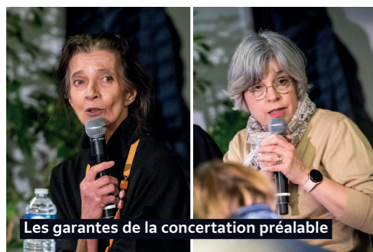
Les garantes de la concertation préalable