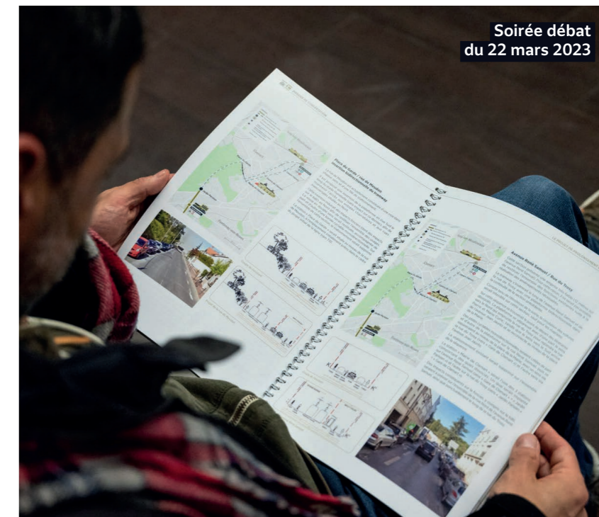
Soirée débat du 22 mars 2023

Un travail exigeant en perspective qui se poursuivra après le lancement au printemps 2024 de la nouvelle phase d'études techniques, pour affiner la définition et les conditions de mise en œuvre du projet.