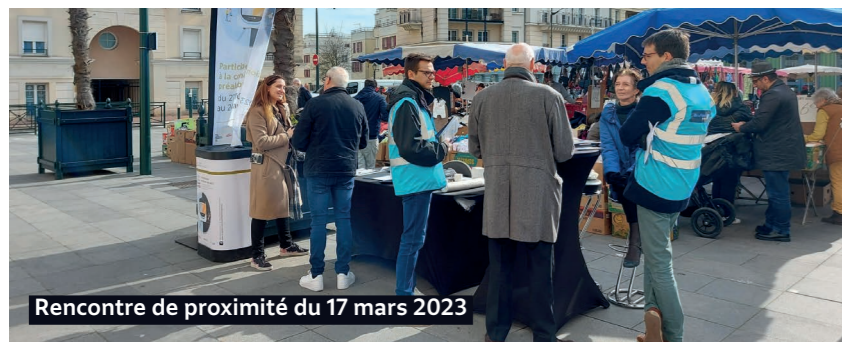
Rencontre de proximité du 17 mars 2023